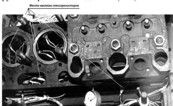
Рис. 2 Общий вид размещения тензорезисторов в ГРС дизеля 4С8,5/11

Для повышения точности результатов измерений и уменьшения влияния случайных погрешностей каждое измерение повторяли трижды. Окончательный результат определялся, как математическое ожидание этих измерений. Обработка экспериментальных данных заключалась в определении приращения напряжений по сравнению с исходными показателями (перед каждой операцией сборки). Анализ погрешностей позволил оценить их суммарную величину при проведении опытов, не превышающую \pm 6\% . На рис. 2 показан общий вид размещения тензорезисторов в исследуемом групповом резьбовом соединении (ГРС).