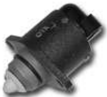
Рис. 3. Регулятор подачи воздуха

Вся необходимая информация передается через линии последовательного обмена UART микроконтроллера и преобразователь интерфейсов на базе MCP2200 на порт USB ноутбука. Каждая посылка включает в себя текущее время, напряжение на выходе с усилителя сигнала термопары, измеряемую температуру и состояние РПВ (0 – закрыт, 1 – открыт). Эти данные для последующей обработки записываются на жесткий диск компьютера в виде текстового файла.