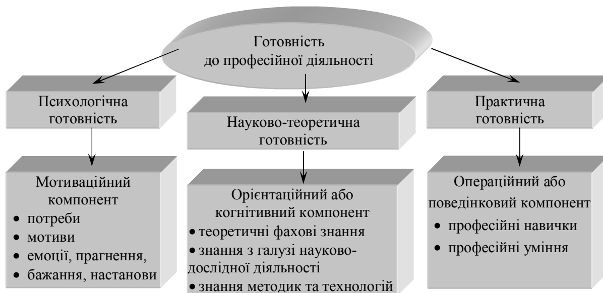
Рис. 1. Структура готовності до професійної діяльності

Структуру готовності до професійної діяльності наведено на рис. 1.