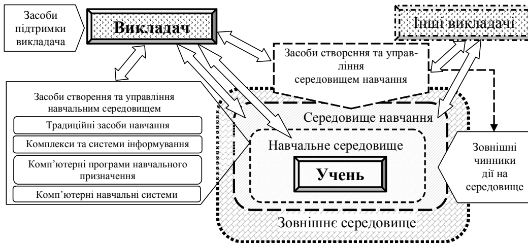
Рис. 2. Модель навчального процесу з використанням ІТН

Наведена модель показує місце засобів, що розкривають сутність поняття “навчальне середовище”, а саме: засобів створення та управління навчальним середовищем, засобів створення та управління середовищем навчання, засобів підтримки викладача. Вказані засоби можуть бути реалізовані комплексом певних інформаційних технологій, вказаних у таблиці, відповідних здебільшого V та VI поколінням інформаційних технологій навчання.