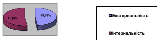
Рис.1. Тип локус контролю студентів

В результаті проведення методики “Когнітивна орієнтація (локус контролю)” ми отримали дані щодо локус контролю досліджуваних: екстернали становлять 48,1%, а інтернали – 51,9% серед студентів технічних спеціальностей.