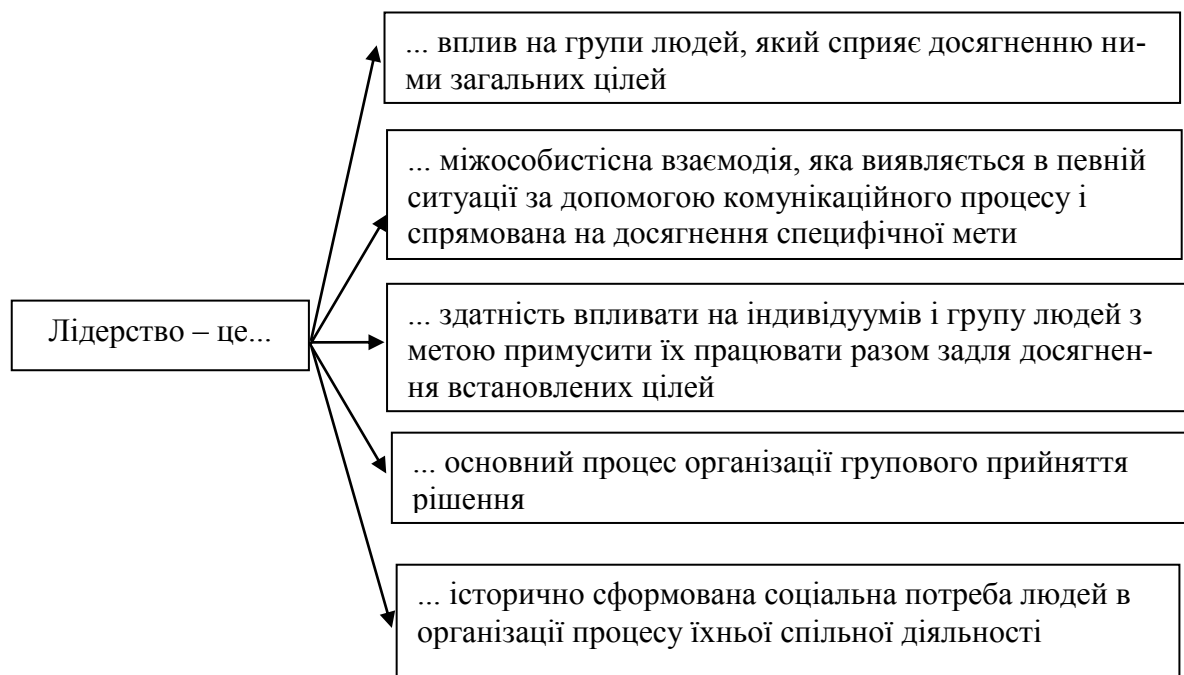
Рис. 1. Визначення поняття „лідерство”

Виклад основного матеріалу. В процесі вивчення проблеми лідерства вченими було запропоновано багато різних визначень цього поняття [1]. Наведемо деякі з них у рис. 1: