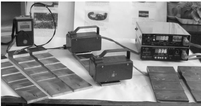
Фото 1 – Заміри коерцитивної сили H_c на зразках зі змінними перерізами різними структуроскопами типу КРМ-ЦК-2М

Аналіз останніх досліджень. В Україні в 2005 році були затверджені «Методичні вказівки з проведення магнітного контролю напружено-деформованого стану металоконструкцій підйомних споруд та визначення їх залишкового ресурсу» МВ 0.00-7.01-05 [5]. Вони базуються на російській методиці «РД ИКЦ «КРАН»-007-97/02» [6].