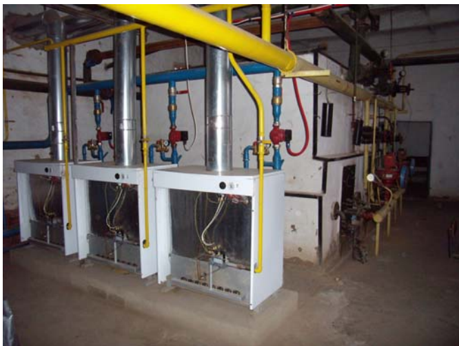
Фото 8. Котельня середньої школи в с. Лебязе

Згідно планів організаційно-технічних заходів проведений ремонт 67 котлів, заміна трубопроводів тепломереж довжиною 1,49 км, водопровідних мереж – 1,8 км, відновлення теплової ізоляції трубопроводів теплоносія в обсязі – 3,5 км, ремонт покрівель у будівлях площею 393,5 м 2 , заміна обладнання ХВО в 3-х котельнях. На підготовку об'єктів до сталого функціонування в зимовий період витрачено 513,065 тис. грн. У планах капітальних ремонтів по всіх 5 філіях підприємства включені заходи по реконструкції котельень, заміні зношених ділянок тепломереж, трубопроводів холодної води, встановлення сучасних газових та твердопаливних котлів.