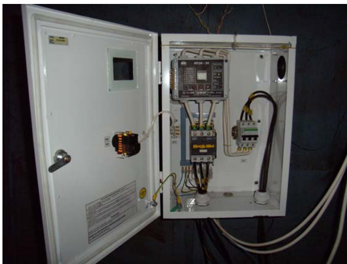
Фото 1. Станція управління «Каскад –К»

КПВВ «Джерело» надає послуги з водопостачання та водовідведення населенню с.м.т. Краснокутськ. Основним паливно-енергетичним ресурсом, яке використовує підприємство, є електроенергія. У план організаційно-технічних заходів з підготовки до опалювального сезону включено ремонт водопровідних, каналізаційних мереж, підготовку топкових, утеплення виробничих корпусів. На протязі року на всіх 13 артсвердловинах були замінені глибинні насоси типу ЕЦВ-6-10-185, впроваджені станції управління «КАСКАД-К» з мікропроцесорними приладами «МПЗК-50» (фото 1), які забезпечують захист електроприводу від перевантажень та подовжують термін експлуатації обладнання. У компресорній станції очисних споруд для зменшення витрат електроенергії замінені 2 повітродувки на менш потужне обладнання типу 24ВФ-М-40. Впроваджено аналогічну станцію управління повітродувками типу «КАСКАД-К». По очисних спорудах також проведено ремонт третьої ступені блоку аеротенків, ремонт напірного колектора. Завдяки автоматизації обладнання, впровадженню нової техніки обсяг використання електроенергії у 2009 році зменшився на 19 %, у порівнянні з попереднім роком. На момент перевірки вартість 1 тис. м 3 газу становила – 2598,30 грн. Щорічне підвищення тарифів на природний газ