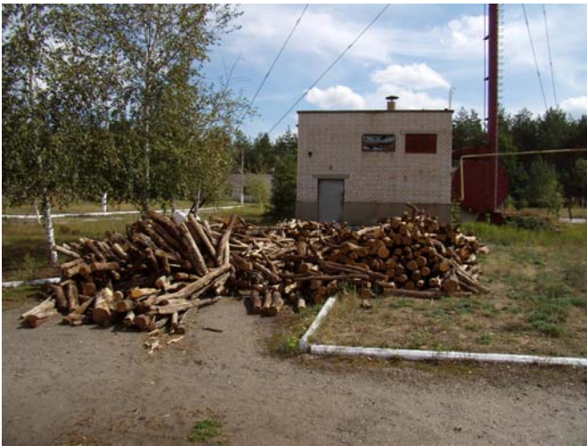
Фото 2. Заготівля палива для палення очисних споруд