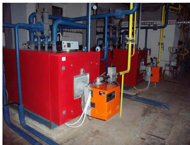
Фото 6. Котли «Колві-300» в с. Богуславка

Вже розроблена проектна документація на перекладання тепломереж окремих котелень з використанням попередньоізольованих трубопроводів, але необхідність великих обсягів капіталовкладень не дає змогу підприємству впровадити всі проекти. Необхідна допомога держави у фінансуванні програми з енергозбереження, що дозволить зменшити собівартість виробництва теплоенергії, підвищити якість надання послуг населенню, бюджетним установам.