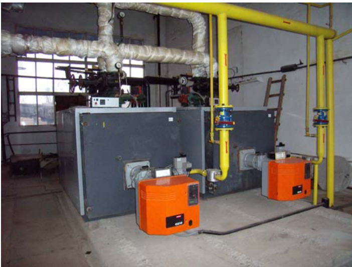
Фото 7. Котельня м. Зміїв, Таранівське шосе, 1Д

За 2009 рік по виконанню програми була отримана економія природного газу – 467,0 тис. м 3 , електроенергії – 193,1 тис. кВт·год, теплової енергії – 1971,0 Гкал. На 2010 рік запланована реконструкція 16 котелень шляхом впровадження сучасних котлів «Колві»-100кВт-36 од., розробка проектної документації на будівництво 7 нових топкових, заміна насосів у котельнях на менш потужне обладнання та продовження робіт з переведення споживачів на індивідуальне опалення з погашення «безперспективних» недовантажених котелень. Для виконання робіт в повному обсязі необхідний обсяг фінансових витрат – 12665,6 тис. грн. Очікувана економія природного газу від впровадження заходів складатиме – 927,98 тис. м 3 , електроенергії – 544,6 тис. кВт·год, теплоенергії близько 3401,0 Гкал. На фото 7 зображено обладнання котельні по Таранівському шосе, 1Д (м. Зміїв).