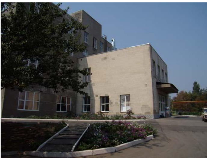
Фото 4. Адмінкорпус КБО «Диканівський»