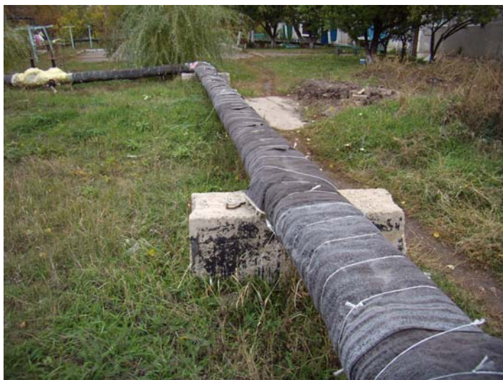
Фото 5. Внутрішньоквартальні тепломережі с. Богуславка

Борівське комунальне підприємство теплових мереж надає послуги з теплопостачання населенню, підприємствам с.м.т. Борова та ще у 8 населених пунктах району. На обслуговуванні у Борівського КПТМ знаходяться 9 котелень, 19,2 км теплових мереж. На підготовку обладнання котелень передбачені фінансові витрати обсязі 506,63 тис.грн. Виконувались наступні роботи: заміна та ремонт ділянок тепломереж від 3-х котелень, відновлення теплоізоляції трубопроводів (фото 5), ремонт котлів, насосного обладнання. Також за останні 3 роки для підвищення ефективності використання природного газу проведено значний обсяг робіт по реконструкції котелень із заміною застарілого обладнання на більш сучасне з більш високим ККД. При реконструкції котелень