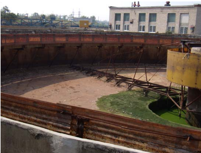
Фото 3. Первинний відстійник в ремонті