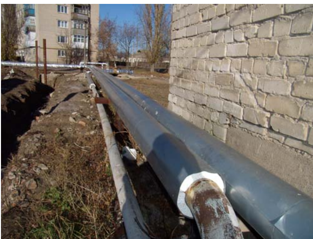
Фото 13. Утеплені пінолістіролом внутрішньоквартальних тепломережі

Перед опалювальним сезоном проводились роботи з утеплення внутрішньоквартальних тепломереж від котельні м. Куп'янськ по вул. 1-го Травня, 55 (фото 13) пінолістіролом.