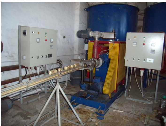
Фото 9. Механічні преси типу ПМ-500

Для реалізації програми в повному обсязі необхідний обсяг коштів – 48,887 тис. грн. Окремо слід виділити програму по використанню відновлювальних джерел енергії. На базі Шевченківської філії в 2009 році створено виробництво брикетів з соломи та відходів деревини. У виробничому приміщенні встановлені 2 механічні преси типу ПМ-500 вітчизняного виробництва (фото 9) у комплекті накопичувальними бункерами та соломорізками. Вартість 1 т соломи складає 350 грн, теплотворна здатність брикетів