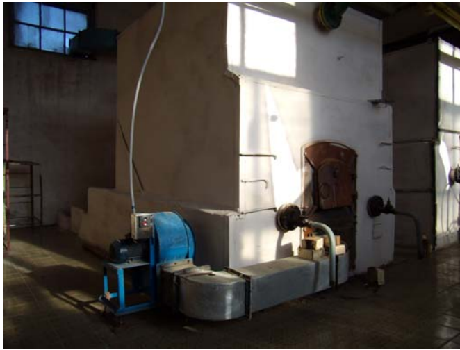
Фото 10. Котел НИИСТУ-5