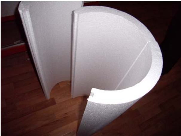
Фото 11. Скорлупи з пінополістиролу

Перед опалювальним сезоном проводились роботи з утеплення внутрішньоквартальних тепломереж від котельні м. Куп'янськ по вул. 1-го Травня, 55 (фото 13) пінолістіролом.