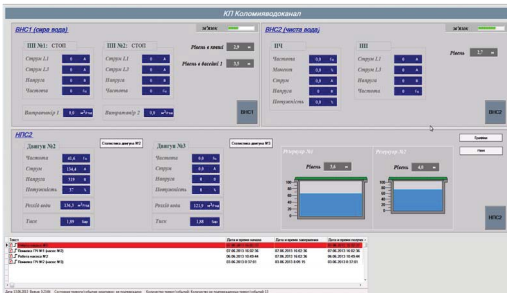
Рис. 3 Головна сторінка екрану серверної станції

Оператор на диспетчерському пункті отримує повну інформацію про стан насосних станцій. Як приклад, на рис. 3 наведена головна сторінка екрану серверної станції диспетчера. На цій сторінці відображається інформація про стан та режими роботи всіх трьох насосних станцій, а саме: стан насосів (увімкнений/вимкнений), основні біжучі параметри електродвигунів (струм, напруга), рівень води у резервуарах, дані витратомірів, тиск на напірному трубопроводі НПС2.