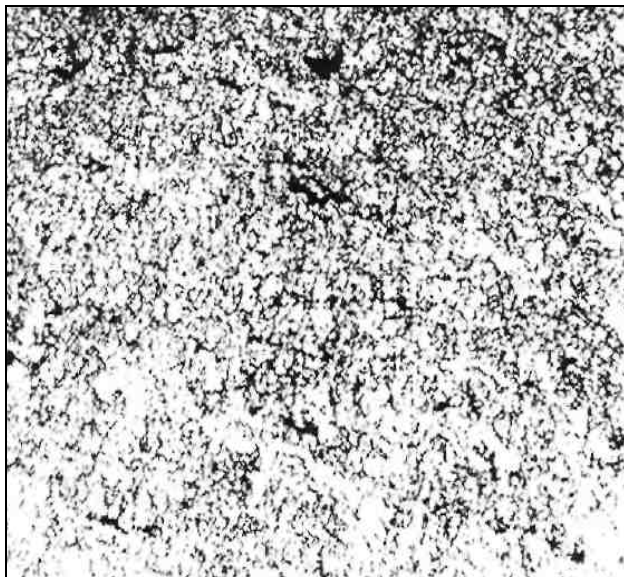
Рис. 1. Мікроструктура дослідного екологічно безпечного контактного матеріалу (збільшено в 150 разів)

Структура поверхні руйнування енергією електричної дуги тісно пов'язана з фізико-механічними властивостями оксидів і цирконію, розмірів частинок оксидів, їх об'ємної кількості і міцності поверхні розділу.