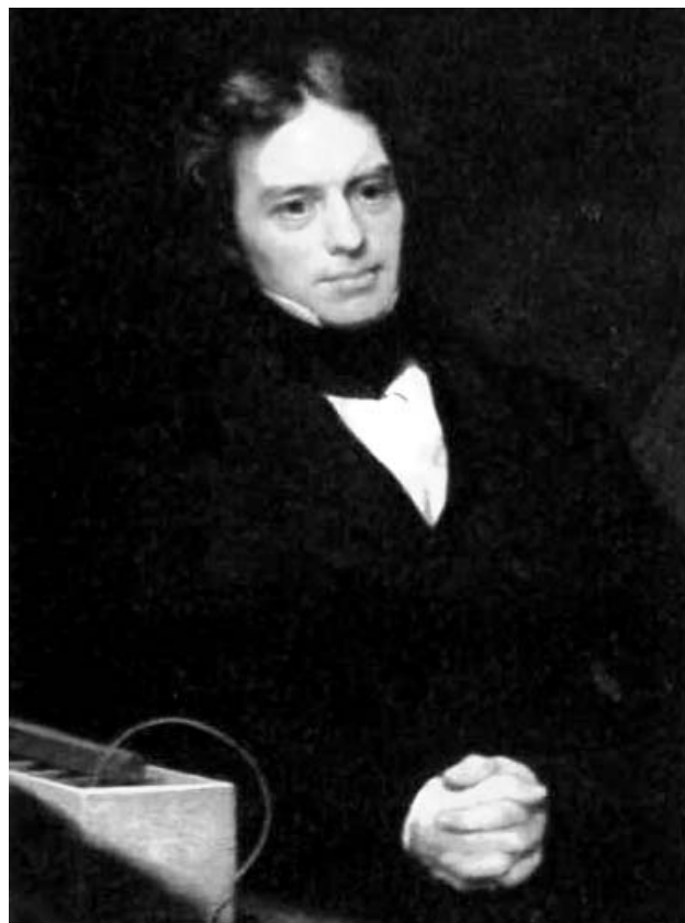
Рис.1. Майкл Фарадей (1791–1867 гг.) в период открытия им фундаментального закона электромагнитной индукции

Родился Майкл Фарадей 22 сентября 1791 года в предместье английского г. Лондона в простой семье рабочего-кузнеца [6]. После окончания начальной школы он с 13 лет стал работать учеником в переплетной мастерской одной из лондонских типографий. Тяга к знаниям подталкивала и заставляла его интересоваться содержанием материала книг, которые он переплетал. В эти юношеские годы он особенно любил разделы "Британской энциклопедии", посвященные физике и химии. Став взрослее, Майкл по вечерам стал посещать лекции в Британском Королевском институте, проводимые известным английским химиком и физиком Гемфри Дэви, оказавшим в целом положительную роль в судьбе М. Фарадея [3, 7]. С тех пор он стал мечтать о работе у него в любой должности. Так в напряженной физической работе переплетчика и учебно-научном самообразовании прошло для молодого Майкла восемь лет его жизни.