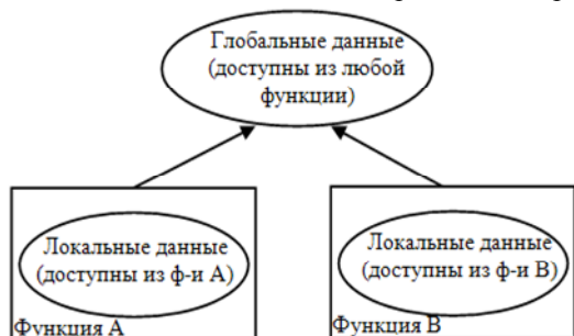
Рис. 1. Глобальные и локальные данные

проекта, которые являются наиболее важными. Любой функциональный модуль имеет доступ к глобальным данным. Схема, иллюстрирующая концепцию локальных и глобальных данных, приведена на рис. 1.