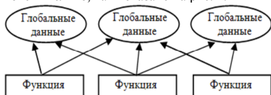
Рис. 2. Процедурный подход

Большие программы обычно содержат множество функциональных модулей и глобальных переменных. Проблема процедурного подхода заключается в том, что число возможных связей между глобальными переменными и функциональными модулями может быть очень велико, как показано на рис. 2.