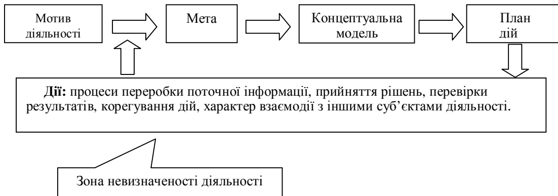
Рис. 1 - Психологічна структура діяльності (за О.С. Анисимовим)

За такого підходу враховуються індивідуальні властивості суб'єкта, інтереси, морально-вольові якості, професійна майстерність та індивідуальність у цілому, тобто ті фактори, що безпосередньо впливають на мотиви діяльності, цілі та дії [10]. Це також дає можливість визначити умови появи та розвитку стилю діяльності.