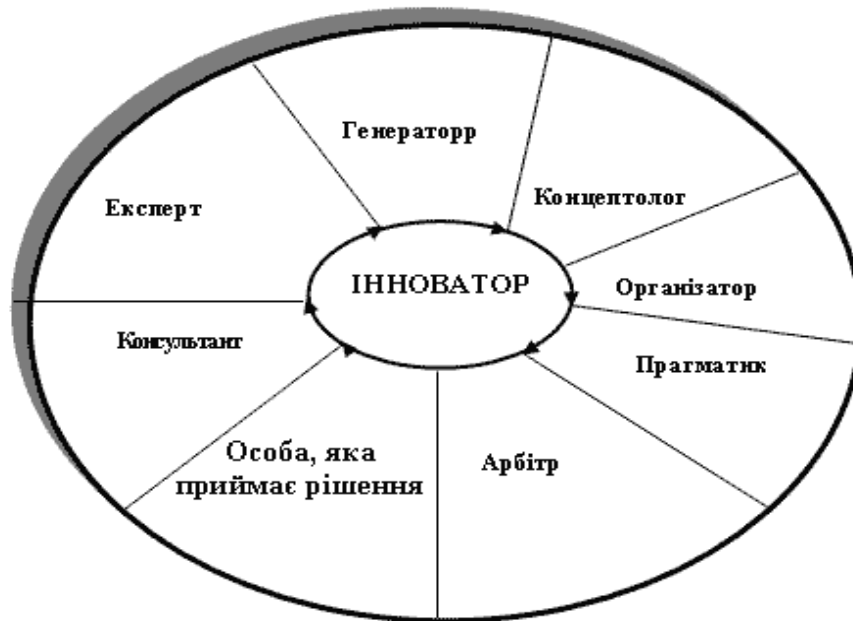
Рисунок 2 – Взаємозв’язок діяльності інноватора з професійними ролями фахівця

Так, концептолог у наведеній моделі виступає як провідник концепції управління інноваційною діяльністю; генератор ідей – як накопичувач творчих пошуків та прагнень особистості; організатор – як конструктор (архітектор) організаційної роботи; арбітр – як головна особа у вирішенні спорів і конфліктів; консультант – як людина, спроможна давати корисні поради, пропозиції та рекомендації; особа, що приймає рішення – як людина, що бере на себе певну відповідальність; експерт – як особа, здатна здійснювати кваліфікований аналіз та ґрунтовно оцінювати певні явища.