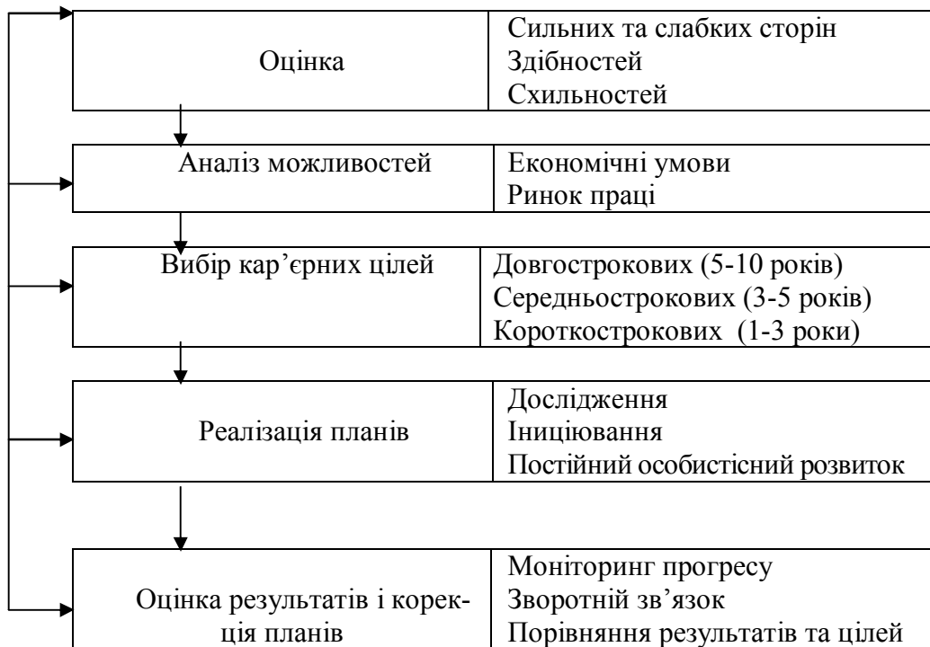
Рис.1 П'ять кроків до кар'єри

Поняття кар'єри має кілька видів класифікацій. Американський дослідник Д. Сьюпер запропонував одну з перших класифікацій. У ній виділені чоловічі та жіночі типи кар'єр у залежності від чергування професійних проб і періодів стабільної роботи. До чоловічого типу зараховують: 1) стабільну (суб'єкт відразу після навчання займається професійною діяльністю і слідує обраному шляху); 2) звичайну (після навчання відбувається серія професійних проб, які закінчуються стабільною службою); 3) нестабільну з чергуванням професійних проб і періодів стабільної роботи; 4) кар'єру з множиною проб з часто змінними видами зайнятості, відсутністю стабільності. Специфіка кар'єрного зростання пов'язана з активним проявом на початковому етапі останніх двох типів. Для того, щоб прийти молодому фахівцю до перших двох видів, у структуру його підготовки повинні входити дисципліни психолого-педагогічного спрямування [22].