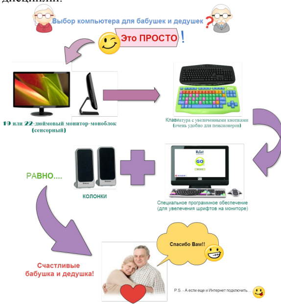
Мал. 1. Інфографіка «Вибір комп'ютера для бабусі та дідуся»

потребує більш глибокого розгляду. Також можна рекомендувати використання візуалізації та інфографіки під час вивчення різних навчальних дисциплін.