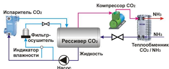
Рисунок 1 – Принципиальная схема каскадной установки с рабочими телами CO_2 - NH_3

сации для 40 °С отвечает давлению в 85 бар). Учитывая эту особенность, в реальных промышленных установках применяются каскадные циклы, в которых на верхней ступени в качестве хладагента применяется аммиак, а на нижней – CO_2 . Принципиальная схема такого цикла приведена на рис. 1 [7].