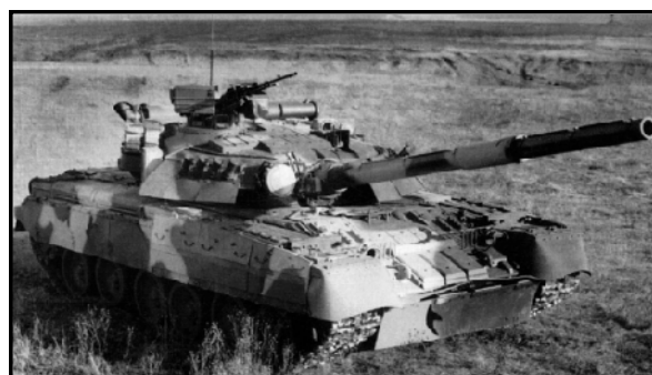
Рис. 3. Т-80УД

Дальнейшее повышение могущества и расширение номенклатуры противотанковых средств привело к созданию в 80-х годах танков следующего поколения. Особенностью защиты танков Т-64БВ, Т-80БВ/У/УД (СССР), «Челленджер» (Великобритания), «Леопард-2» (ФРГ), М1 «Абрамс» (США), АМХ 32 (Франция), STRV-103С (Швеция), «Меркава» Mk1/Mk2 (Израиль) и др. является то, что наряду с баллистической защитой, деформирующее окрашивание, термодымовая аппаратура, дымовые гранатометы становятся неотъемлемой частью конструкции танков. Вводятся мероприятия по снижению температуры моторно-трансмиссионного отсека (МТО), выхлопных газов, снижению радиолокационной заметности [14-16].