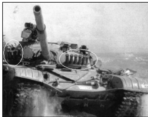
Рис.2. Пусковые установки системы постановки завесы Т-72