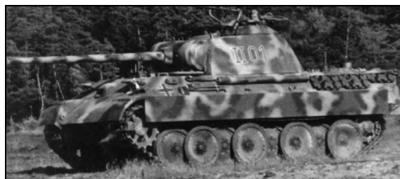
Рис.1. Средний танк «Пантера»

Создаваемые до этого периода танки не обладали необходимыми характеристиками: средние - защищенностью и огневой мощностью, тяжелые - подвижностью. Появляется новый тип танка следующего поколения –