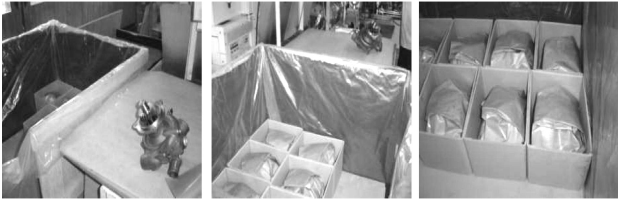
Рис.2. Вариант индивидуальной упаковки продукции в антикоррозийную бумагу

Характеристика ЛИК-метода приведена в таблице 1.