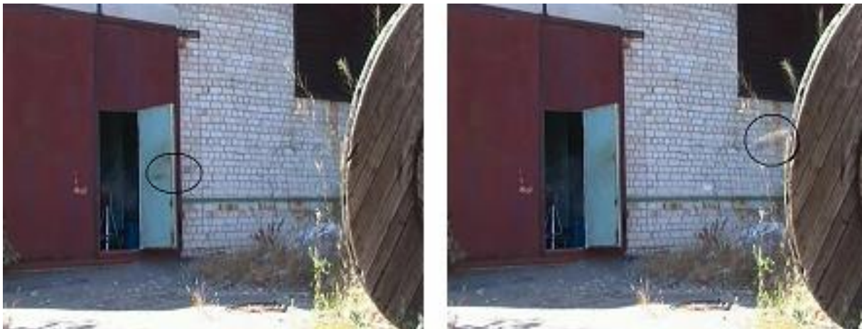
Рис. 2. Кадри польоту тіла, що метається. (тіло обведено колом)

В результаті експериментальних досліджень виявлено зниження помітності пострілу у оптичному діапазоні. Даний результат отримано за результатами обробки кадрів відео зйомки (рис 3, 4). Практично за однаковою дистанцією відльоту снаряду від ствола газодетонаційної установки, область світимості продуктів згорання у режимі дефлаграційного згорання не менше, ніж у два рази перевищувала відповідну область у режимі детонаційного згорання. Для подальшого зниження помітності пострілу необхідно збільшувати довжину секції прискорення, що забезпечить зниження температури продуктів детонації за рахунок процесу їх розширення. В першому наближенні температуру газу на виході з каналу ствола можливо визначити за законом адіабати по виразу