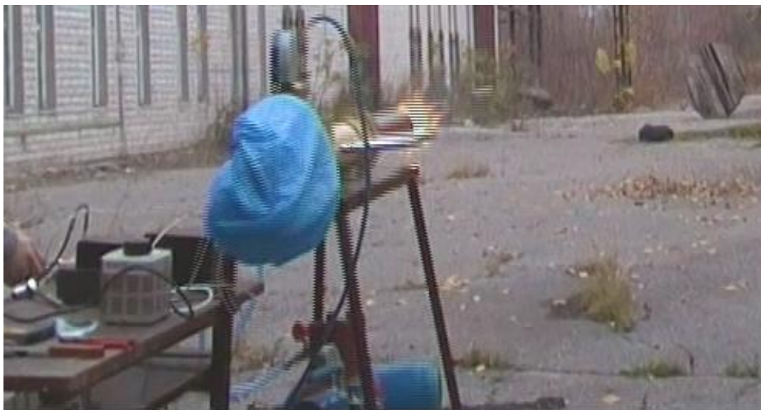
Рис. 4. Світимість продуктів згорання при стрільбі з детонацією

За вище визначеними умовами у режимі детонації була проведена серія досліджень для тіл відповідної маси та отримані наступні результати (табл. 1). Обробка експериментальних результатів проводилась методом найменших квадратів. При ймовірності, що довіряється, рівній 0,9 маємо коефіцієнт Ст'юдента 2,13.