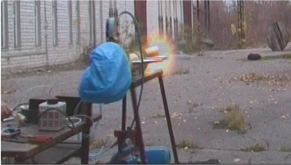
Рис. 3. Світимість продуктів згорання при стрільбі без детонації

З виразу (1) маємо, що у разі розширення продуктів детонації у 4 рази зниження температури продуктів детонації відбудеться у 1,74 рази (при \gamma = 1,4 ). Тепловтрати, пов'язані з передачею теплової енергії каналу ствола також забезпечують зниження температури продуктів детонації, що розширюються.