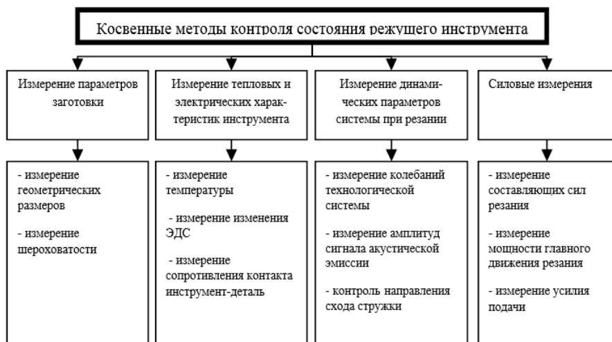
Рисунок 2 – Косвенные методы контроля состояния режущего инструмента

Наиболее «эластичным» направлением в контроле режущих инструментов является мониторинг (непрерывный контроль) непосредственно в процессе обработки. Все методы диагностики текущей работоспособности режущих инструментов можно условно разделить на четыре группы [13], а их, в свою очередь, на методы прямого контроля, основанные на непосредственной регистрации величины износа инструмента, и косвенного контроля (рисунок 2), использующие физические явления, которые сопровождают процессы резания и изнашивания инструмента [12].