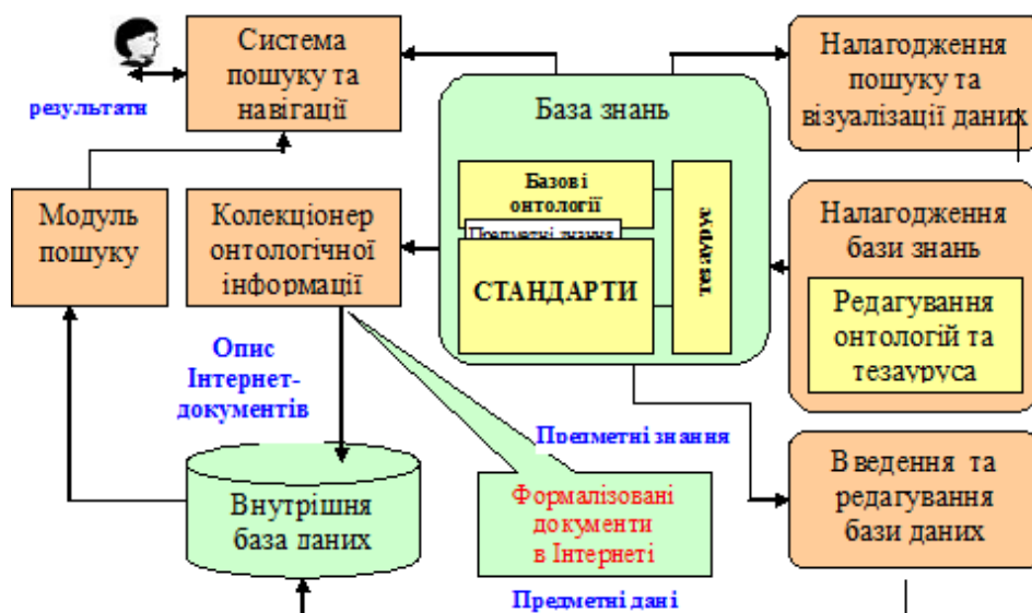
Рисунок 2 – Загальна схема налагодження та доступу до даних та знань порталу

Для налагодження бази знань порталу і управління його контентом використовуються спеціалізовані редактори (редактор онтологій і редактор даних), реалізовані як web -додатки і доступні зареєстрованим користувачам через Інтернет, а також колекціонер онтологічної інформації про ресурси (рис. 2).