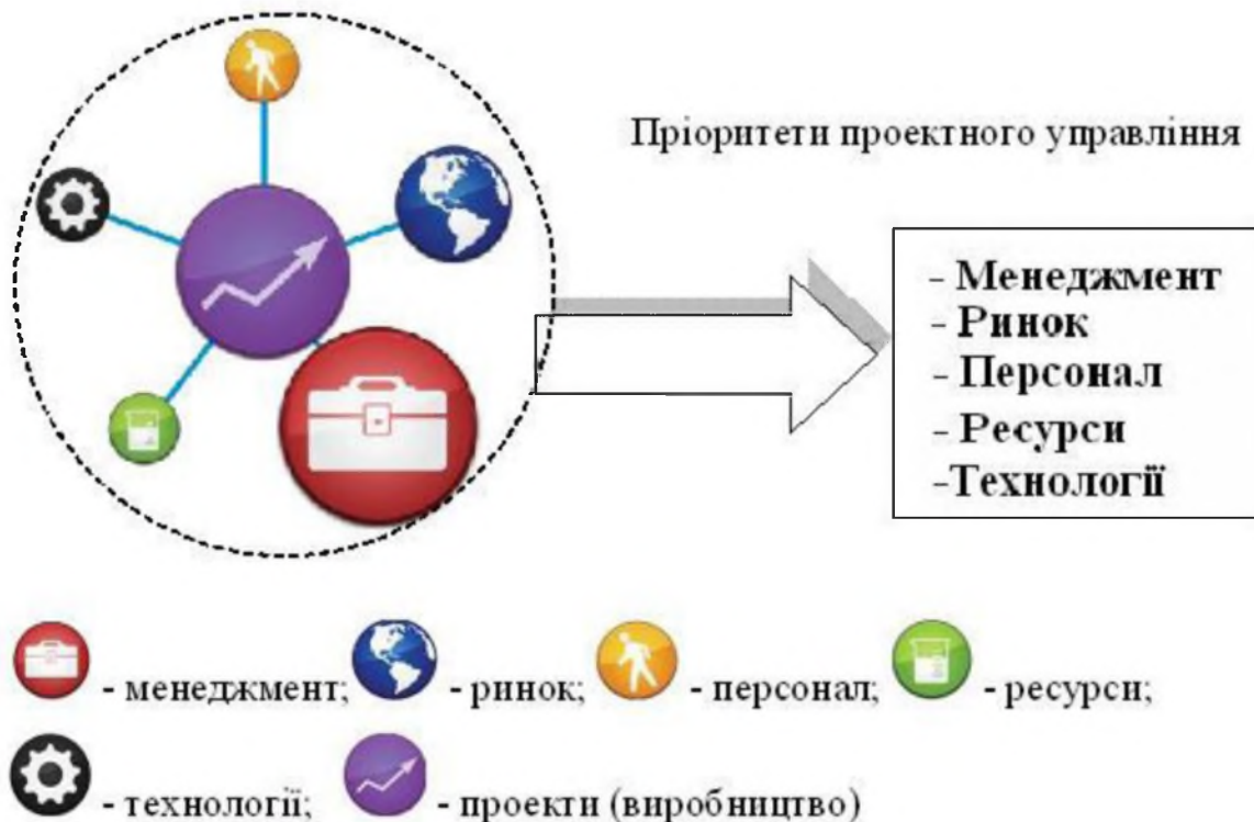
Рисунок 1 – Конкурентне середовище і пріоритети проектного управління

ринкової конкуренції визначається елементами середовища, основними з яких є: персонал, технології, ресурси, менеджмент, ринок і проекти (рис. 1). Доступність і потенційні можливості впливу на ці елементи конкурентного середовища різні [1]. Так, елементи середовища: персонал, технології, ресурси, ринок і проекти в умовах глобалізації економіки доступні в рівній мірі всім і можуть лише трохи поліпшити результативність проектів. Тоді як вдосконалення менеджменту надає потенційні можливості поліпшення результативності проектів у рази [2]. Тому розвиток проектного управління є пріоритетним напрямом стійкого розвитку підприємств. Глобалізація економіки і розвиток міжнародних торгових і виробничих зв'язків створюють умови для підвищення вимог, що пред'являються споживачами до характеристик продукції [3].