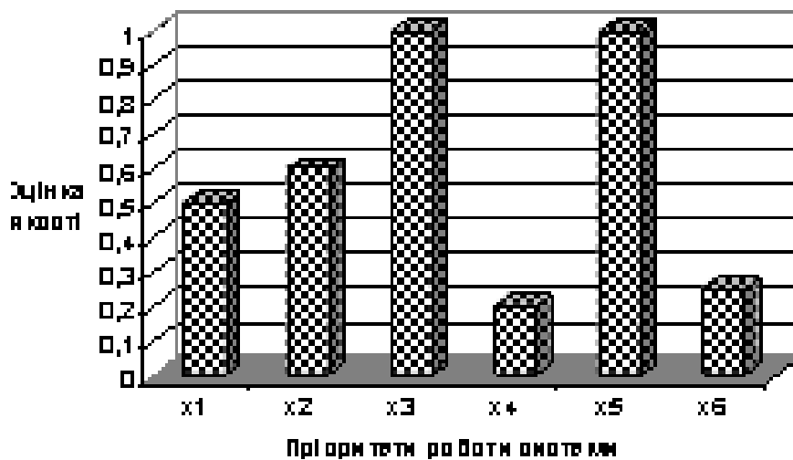
Рисунок 2 – Зведені оцінки якості пріоритетів лі роботи системи що приводить до наступного впорядкування: x_1, x_5, x_2, x_3, x_4, x_6 (рис. 2).