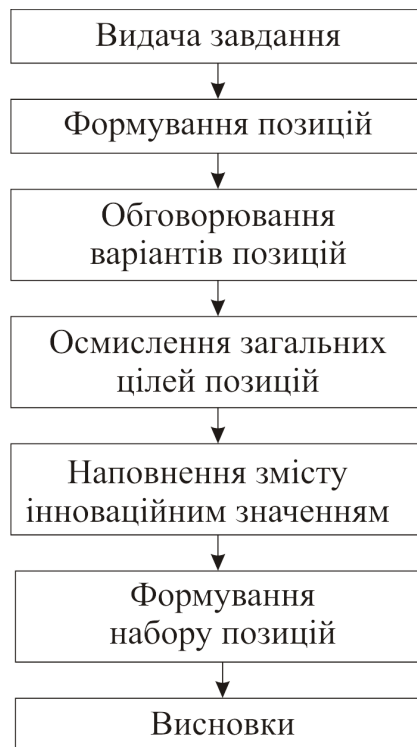
Рис. 4. Функціональна схема підготовки до виконання комплексного інноваційного проекту

Інтерактивне позиціонування – набір позицій аудиторії, осмислювання й створення нового набору позицій – є обов'язковим елементом таких інноваційних проектів (рис. 4).