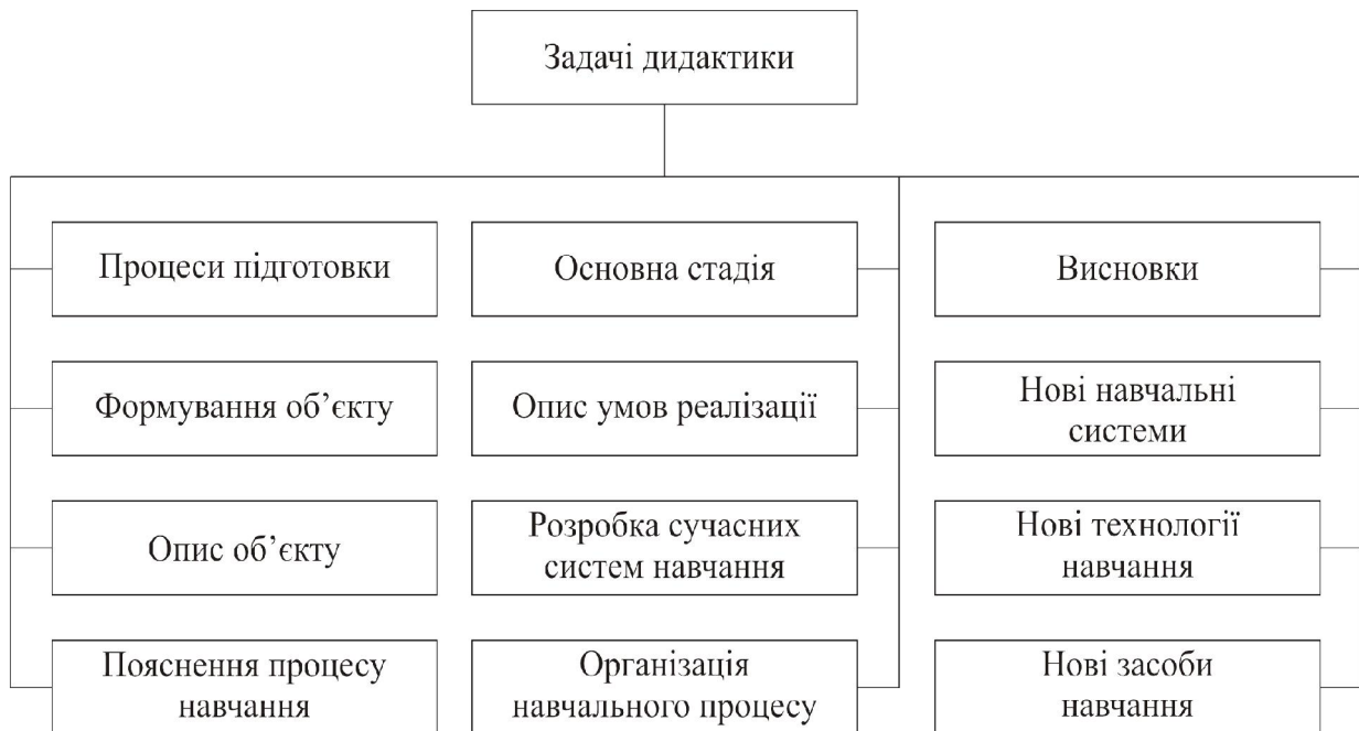
Рис. 1. Функціональна схема задач дидактики при виконанні комплексного інноваційного проекту

матеріал з метою застосування для втілення інноваційних розробок технологічних об'єктів завдання дидактики при виконанні комплексних інноваційних проектів можна представити в наступному виді (рис. 1):