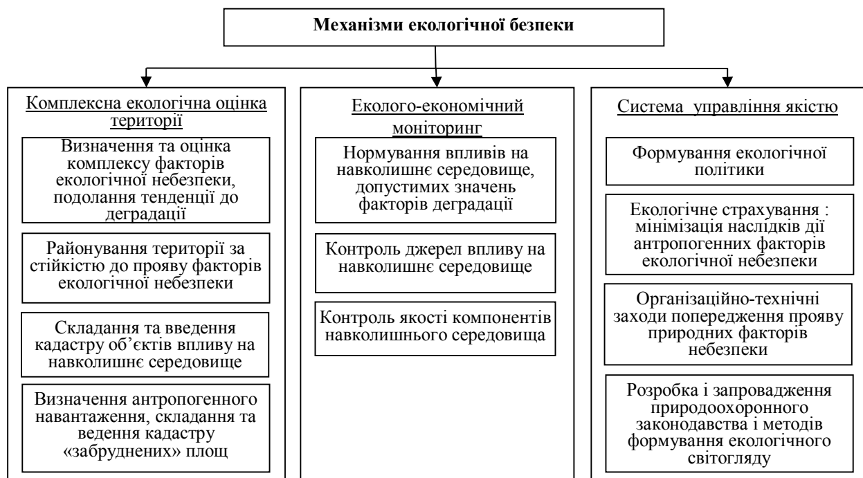
Рис. 2. Механізми екологічної безпеки

формують загальну систему безпеки різномірних системних утворень: комплексна екологічна оцінка території, еколого-економічний моніторинг, система управління якістю (рис. 2) [12].