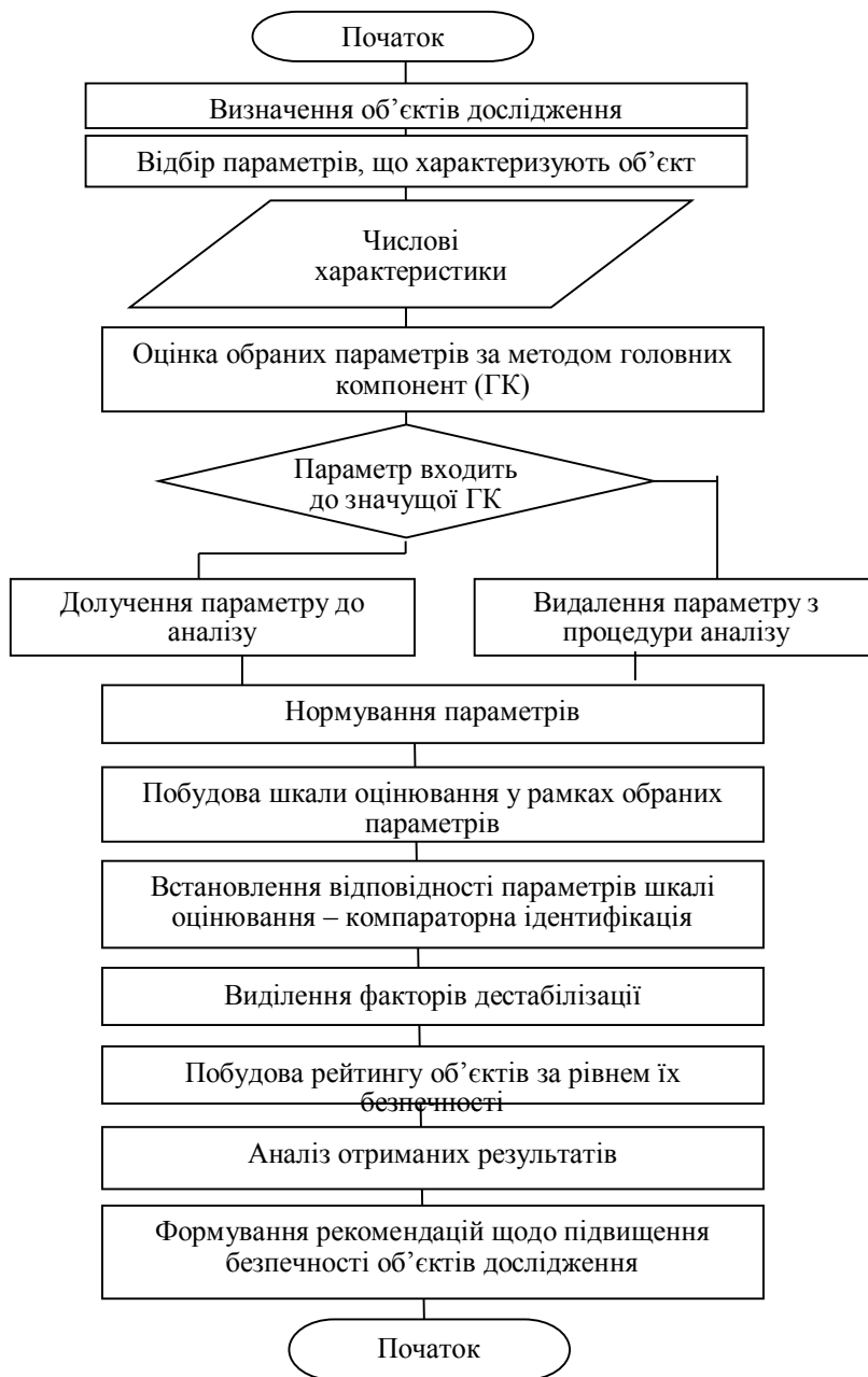
Рис. 5. Реалізація методичного забезпечення аналізу безпеки системних утворень

сенсорних систем, встановлення невідомого оператора і його параметрів. У такому випадку, запропоновані удосконалення методичного забезпечення оцінки якості складних об'єктів на основі комплексування методів головних компонент і компараторної ідентифікації (рис. 5).