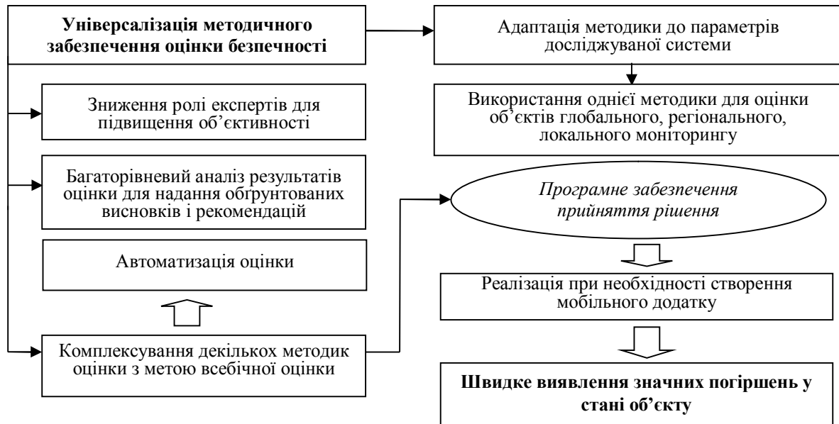
Рис. 4. Система оцінки безпеки системних об'єктів

безпеки з одного боку розуміють як процес вибору, що здійснюється системою під час аналізу можливих альтернатив, а з іншого як процес, завдяки якому збільшуються можливості системи щодо саморегулювання стану підсистем та окремих елементів при наявних впливах і зовнішній дії дестабілізуючого характеру [18].