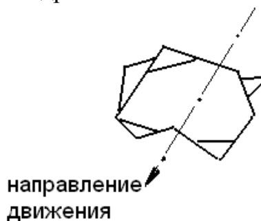
Рис. 3 – Схема беспорядочного расположения выступов зерна

На процесс полирования оказывает влияние реальная поверхность до обработки. Учитывая, что выступающие части зерна имеют смещения относительно направления их движения (рис. 3), обеспечиваемого полировальником, должна появиться вторая горизонтальная составляющая P_z , которая способствует зигзагообразному движению зерен и увеличивает вероятность их столкновения и дробления.