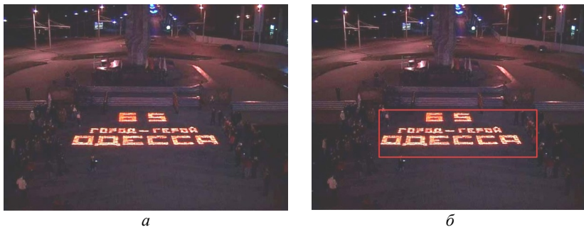
Рис. 2. Пример локализации ТО на изображении с применением предложенного метода: а – исходное изображение; б – результат локализации текстовой области

После обучения сети точность классификации изображений обучающей выборки составила 99,3 %, а контрольной выборки – 77,7 %. средняя скорость обучения сети составила 0,31 с на эпоху, среднее время классификации текстовых областей на изображении 36×64 пикселя составило 0,17 с. Пример работы обученной сети на реальном изображении представлен на рис. 2.