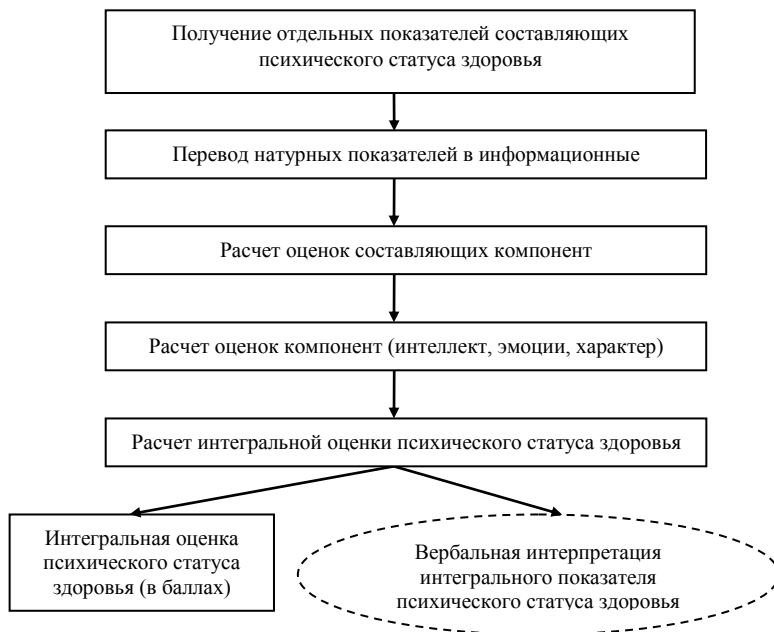
Рис. 2. Схема получения оценки психического статуса здоровья

компонент психического статуса здоровья, который будет рассчитываться как линейно-взвешенная сумма относительных обобщенных значений оценок с соответствующими весовыми коэффициентами. При этом оценка состояния составляющих – это свертка соответствующих информационных показателей, оценка состояния компонент – свертка оценок состояния соответствующих составляющих, оценка статуса – свертка оценок состояния компонент (интеллектуальной, эмоциональной, характерологической).