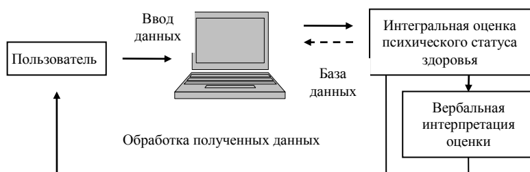
Рис. 3. Общая схема системы оценки психического здоровья человека

Оценка состояния психического статуса здоровья производится по совокупности функциональных показателей различных составляющих психического статуса здоровья. Следует отметить, что интегральные оценки унифицируют и ускоряют процесс первичной оценки психического статуса здоровья. Однако высокая субъективность оценки психического статуса здоровья приводит к низкой достоверности получаемых результатов. Это подчеркивает существующую проблему