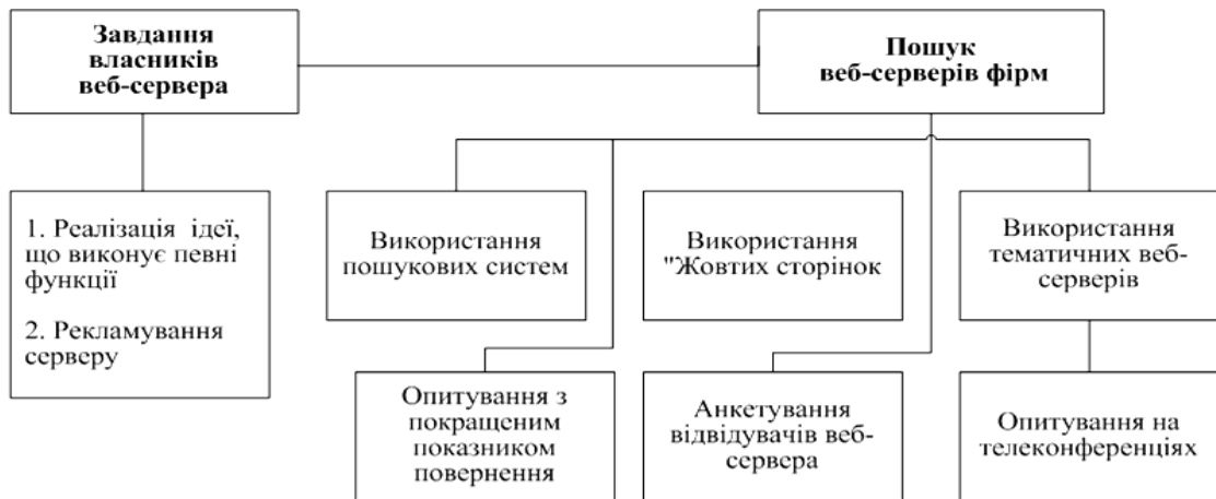
Рис. 2. Використання комунікативних та рекламних можливостей

Центральний елемент реклами в Інтернеті – це веб-сервер фірми. На його основі будується весь комплекс рекламних заходів. Використовується дворівневий підхід, коли на веб-сервері розміщується інформація про туристичну фірму та її туристичні продукти, а рекламні зусилля спрямовуються на привертання уваги відвідувачів на сервер цієї турфірми.