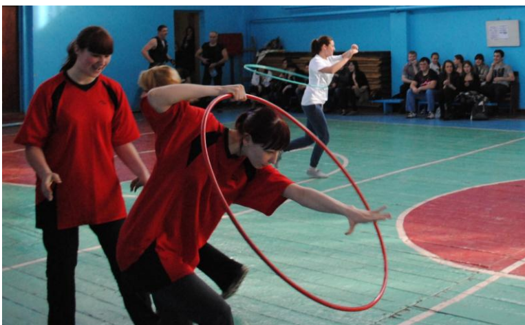
Спортивно-фольклорне свято «Козацькі розваги»