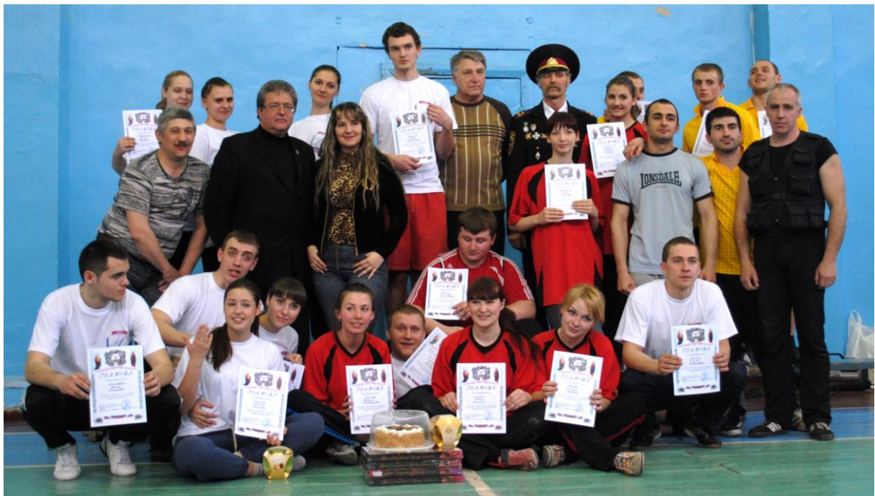
Спортивно-фольклорне свято «Козацькі розваги»