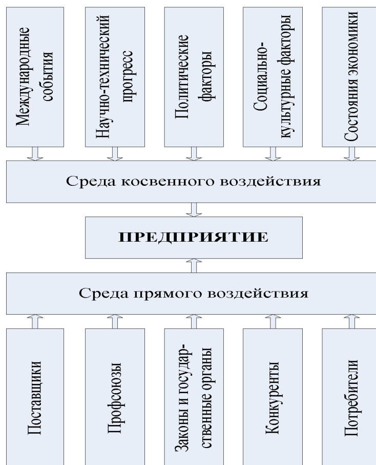
Рис. 1. Факторы внешней среды

В среде прямого воздействия уделяют особое внимание конкурентам. Это важный фактор, поскольку в настоящее время конкурентная борьба во всех экономических сферах продолжает обостряться. Проведение конкурентного анализа, оценивание конкурентоспособности предприятия и ее продукции на рынке актуальны.