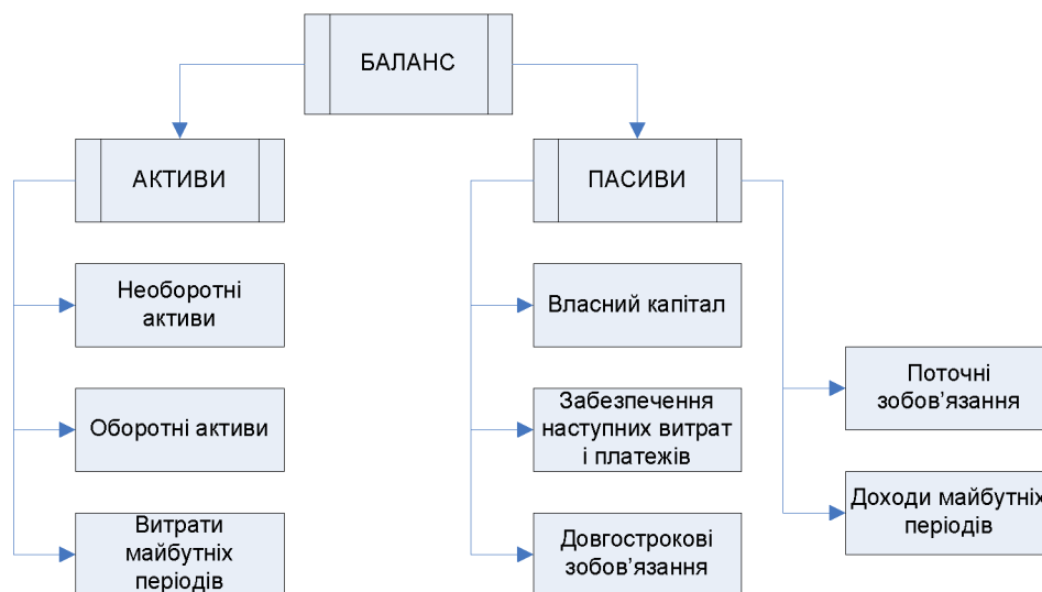
Рис. 1 – Структура балансу підприємства

технологічного оновлення і не будуть реагувати на зміни у складі основних фондів.