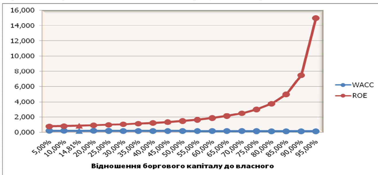
Рис. 2 – Відношення боргового капіталу до власного

2) з появою в структурі позикового капіталу ситуація змінюється: спостерігається зниження WACC і збільшення ROE. Така тенденція спостерігається до рівня коефіцієнта фінансового левериджу рівного (2:1 позикового капіталу до власного). Значить, збільшення частки позикового капіталу до рівня 2:1 однозначно дає позитивний результат, як з боку максимізації рівня фінансової рентабельності, так і мінімізації вартості капіталу, який виражається у збільшенні вартості підприємства, відповідно, і в добробуті акціонерів;