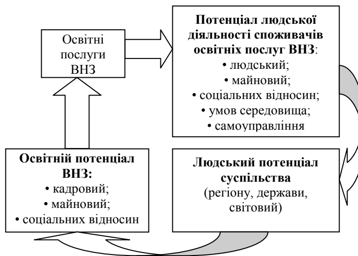
Рис. 3. – Суспільне соціально-економічне значення освітніх послуг ВНЗ

ВНЗ впливають на розвиток потенціалу людської діяльності споживачів, виконуючи власну місію з виховання еліти суспільства, і таким чином роблять вагомий внесок у розвиток людського потенціалу суспільства. Суспільство постійно змінює вимоги до рівня якості освітніх послуг ВНЗ та ресурсного забезпечення його освітнього потенціалу шляхом формування як законодавчих вимог, так і ринкового попиту. Таким чином ці процеси мають постійний взаємний вплив, проілюстрований схемою (див. рис.3).