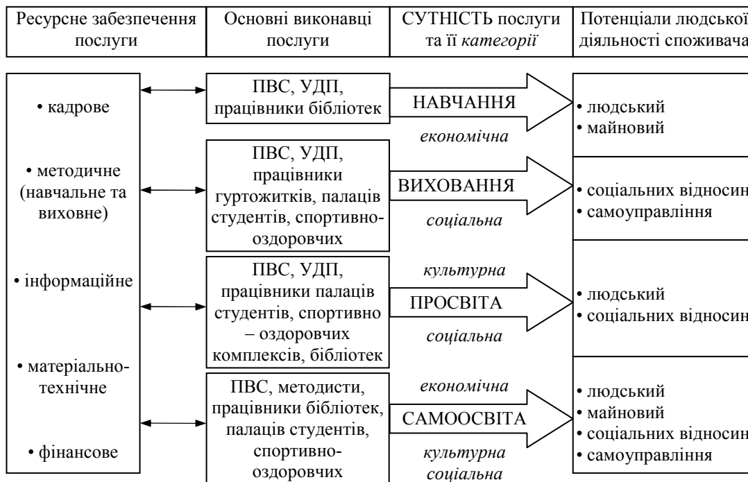
Рис. 2 – Сутність освітніх послуг ВНЗ та процес їх надання

Отже, можна стверджувати, що освітня послуга ВНЗ є економічною, культурно-просвітницькою і соціально значущою категорією суспільно важливої освітньо-виховної діяльності ВНЗ, яка спрямована на розвиток потенціалу людської діяльності її споживача та людського потенціалу суспільства і реалізується в результаті процесів навчання, виховання, просвіти та самоосвіти її споживачів.