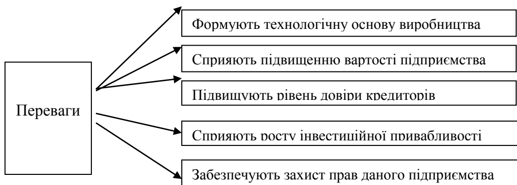
Рис. 2 – Переваги від використання НМА у діяльності підприємства

Загалом, слід наголосити, що НМА відіграють досить важливу роль у діяльності підприємства (див. рис. 2): є основою та індикатором технологічного розвитку підприємства, відображають інноваційну спрямованість його діяльності. Дані активи створюються та купуються заради досягнення позитивного ефекту функціонування підприємства, який втілюється в показниках результативності діяльності.