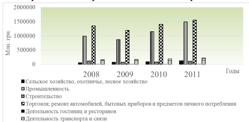
Рис. 2 – Динамика объемов реализованной продукции субъектов реального сектора экономики Украины по видам экономической деятельности за период 2008-2011 гг., млн. грн.

Как видим, рис. 2 иллюстрирует рост объемов реализованной продукции субъектов реального сектора экономики Украины по всем видам экономической деятельности за анализируемый период. Однако, несмотря на сложившуюся тенденцию субъекты хозяйствования строительства, гостиниц и ресторанов так и не смогли получить прибыль на протяжении всего периода.