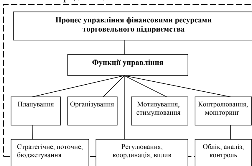
Рис. 2 – Функції управління фінансовими ресурсами підприємства на основі процесного підходу

взаємопов'язаних елементів, що орієнтовані на досягнення певних цілей і тісно переплетені з зовнішнім середовищем.