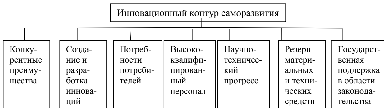
Рис. 2 – Факторы создания новых инновационных контуров

Формирование инновационных контуров напрямую зависит от ряда факторов, представленных на рисунке 2.