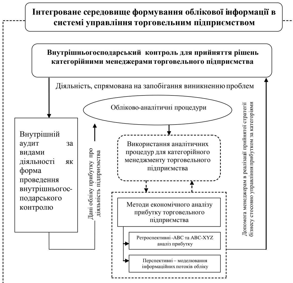
Рис. 2. – Формування облікової інформації для прийняття управлінських рішень, авторська розробка

ринкової структури з метою надання інформації для прийняття управлінських рішень, що зображено на рисунку 2.