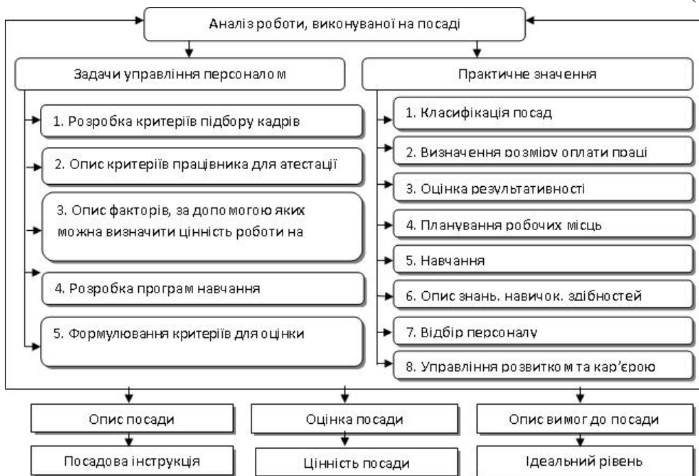
. 2 –