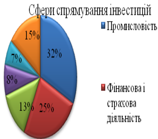
Рис. 3 – Розподіл іноземних інвестицій між галузями економіки України

Більша частина залучених іноземних інвестицій припадає на українську промисловість – 16,080 млрд. дол., а також на установи фінансової і страхової діяльності – 12,669 млрд. дол., підприємства оптової і роздрібною торгівлі, ремонту автотранспортних засобів і мотоциклів – 6,424 млрд. дол., організації з роботи з нерухомістю – 4,047 млрд. дол., наукові і технічні організації – 3,313 млрд. доларів США. Розподіл іноземних інвестицій між галузями економіки України представлено на рисунку 3.