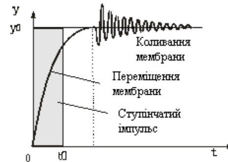
Рисунок 2 - Перехідний процес мембрани після дії збуджуючого сигналу

Після досягнення максимального значення переміщення за рахунок накопиченої кінетичної енергії мембрана починає коливальний процес з деякою частотою, яка може бути звуковою або навіть ультразвуковою. Таким чином на границі усталеного положення має місце реологічний перехід руху мембрани, який характеризується реологічним перетворенням механічної енергії в коливальну. За рахунок витрати цієї енергії в середовище, яке оточує мембрану, проходить її стік. Такий процес характеризується перенесенням імпульсу механічної енергії мембрани в коливальну енергію. Перехідний процес хлопаючої мембрани при дії на неї імпульсу збуджуючої енергії показаний на рис. 2.