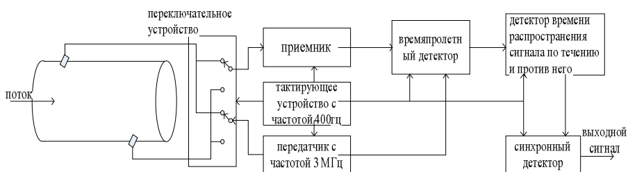
Рис.2. Схема ультразвукового расходомера, в котором каждый кристалл играет роль и передатчика, и приемника.

где погрешность E_c устанавливает связь между измеренным значением количества теплоты и его, значения E_c и E_t для класса 1 определяют тогда, когда усовершенствования методик испытаний и преобразований расхода позволяют это сделать .