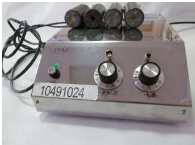
Рис. 1 – Чотириканальний аналізатор імпульсів для одночасного вимірювання альфа-, бета-, гамма- та нейтронного випромінювання

В чотирьох багатоканальних аналізаторах імпульсів використовувались передсилювач ОРА 27, шістнадцяти розрядний АЦП ADS 8361, восьми розрядний мікропроцесор 16F877А, малошумлячий з високоомним опором та високою швидкістю наростання сигналу підсилювач AD8033. В аналогово-цифровому перетворювачі використовувалися дванадцять розрядів АЦП з можливістю використання додаткових розрядів для підвищення роздільної здатності.