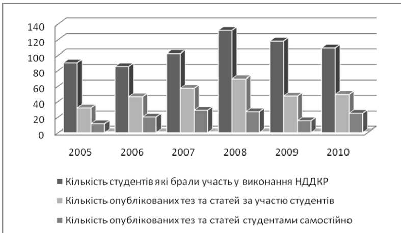
Рис. 2 – Динаміка залучення студентів до виконання НДДКР та публікації наукових робіт

Головний доробок проф. Р. Г. Долінської переключиться з попереднім напрямом і спрямований на дослідження інструментів контролінгу як чинника забезпечення конкурентоспроможності вітчизняної економіки [12].