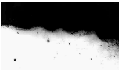
Рис. 1. Микрорельеф поверхности литой среднелегированной стали после гомогенизирующего нагрева: сталь без покрытия – в газовой печи (а); в электрической печи (б); сталь под покрытием в электрической печи (с)

Формирование двухслойного термомобильного покрытия в процессе высокотемпературного нагрева низколегированной стали перед прокаткой иллюстрируется схемой на рис. 2.