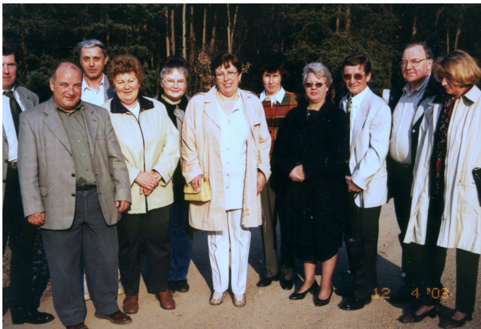
Рис. 21 – Випускники кафедри ОМТ НТУ ХПІ 60-х років у 2007 році

Викладачі кафедри приймали участь у роботі за кордоном.