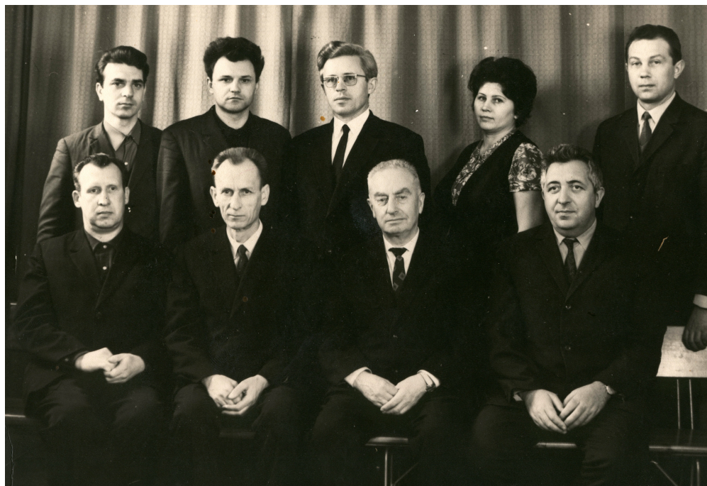
Рис. 13 – Склад викладачів кафедри ОМТ у 60-роки