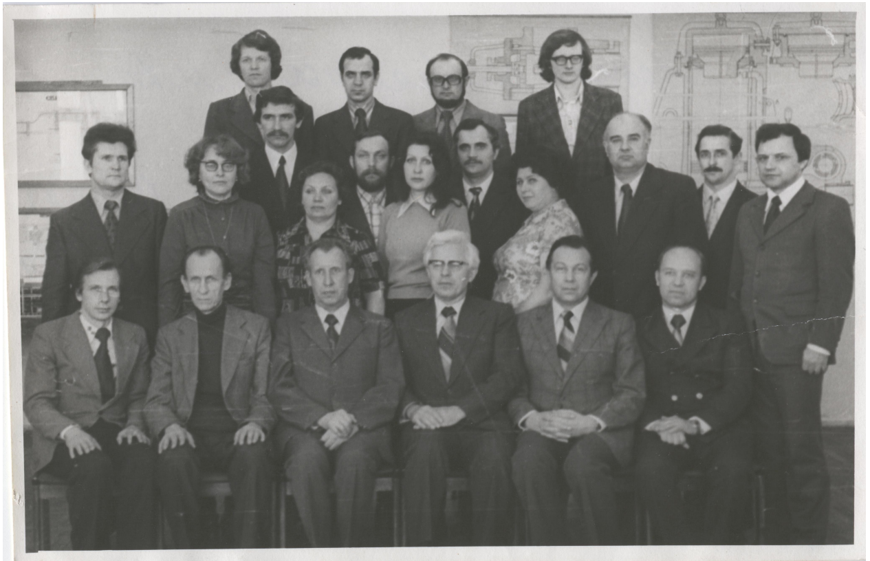
Склад інженерно-технічної частини лабораторії НДЛ ТШ