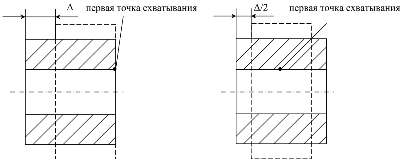
Рис. 3 Влияние первой точки схватывания на величину зазора

Так как при сборке с нагревом избежать образования зазора без дополнительных технологических или конструкторских решений невозможно. Поэтому в многоэлементном соединении при расчете сборочных размерных цепей для уменьшения погрешности получения значения замыкающего звена целесообразно учитывать дополнительную величину (\beta_{BT} AT_{BT} + \Delta_o) .