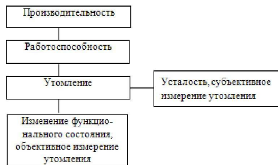
Рис.1. Схема взаимосвязи производительности и утомления

Существует определённая взаимосвязь между функциональным состоянием человека, утомлением, работоспособностью и производительностью труда (рис. 1) [3].